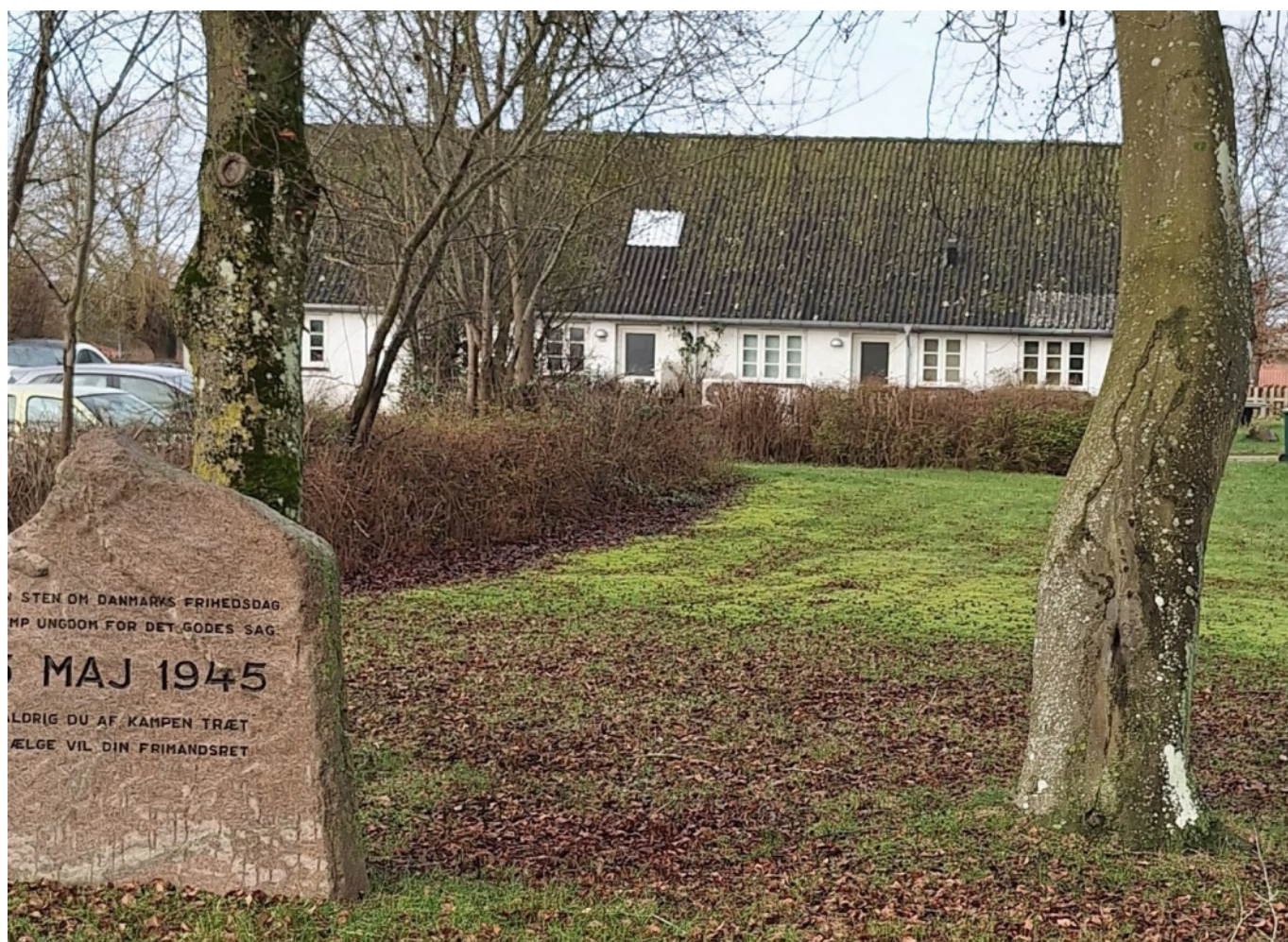
Huset på Byvejen i Osted. Det fungerede som fattighus fra 1874 til o. 1918