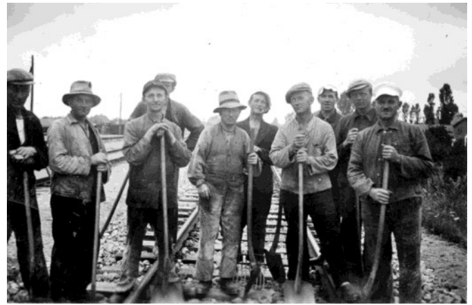
Banearbejdere i nærheden af Hvalsø Station (Ca. 1940-1945)

Den første ladning jernbaneskiner ankom fra Cardiff. De første sveller ankom fra Riga. Indledningsvis var der bestilt otte lokomotiver og 85 godsvogne til banen. Byggearbejdet mødte store vanskeligheder i forbindelse med vandforsyningen, da vandet i området var (og er) meget kalkholdigt. Man måtte derfor til Bredekilde efter egnet kildevand.