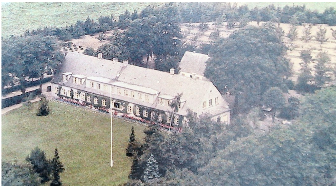
Ørsted fattiggård, senere alderdomshjem og plejecenter