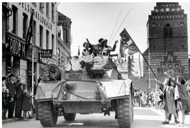
Engelske soldater, der kommer til Roskilde i befrielsesdagene 1945