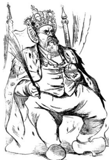
”Kongen af Bogø” fra Folkets Nisse

købstadskolerne blev sidestillet med hensyn til undervisningens indhold. På det tidspunkt hed kultusministeren J.C. Christensen og hørte til i Venstre. Og der skulle yderligere gå lidt over 100 år - til 2006, før den konservative del af Folketinget stemte for en lov om folkeskolens form og indhold. På det tidspunkt hed statsministeren Anders Fogh Rasmussen og undervisningsministeren Bertel Haarder, som gennem sit lange politiske liv altid førte sin statsministers politik. For at få den konservative del af Folketinget med havde Fogh Rasmussen undervejs måttet ofre sin oprindelige undervisningsminister, partifællen Ulla Tørnæs, som holdt fast i den grundholdning for børns undervisning, der først blev lagt frem af Ludvig Holstein-Ledreborg i 1872.