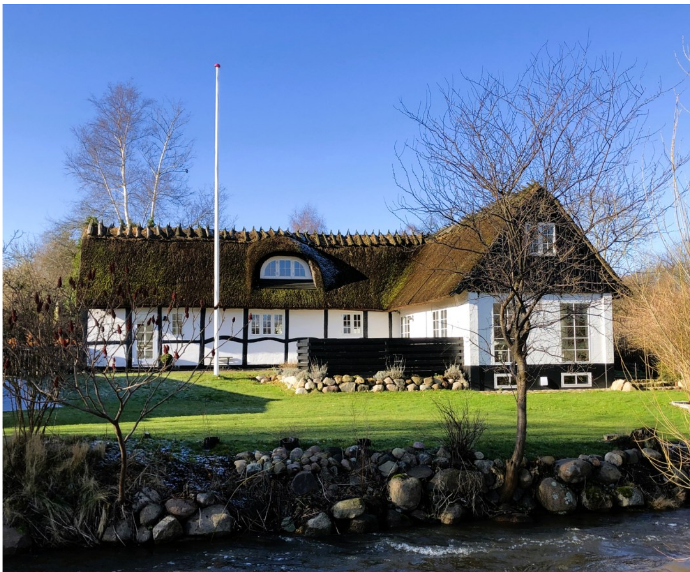
Degnehuset set fra haven