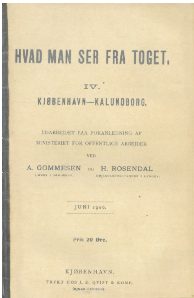
"Hvad man ser fra Toget" (1906)

efterfølgende gav audiens. I Kalundborg Varehus blev der afholdt festmiddag. Kongen og kronprinsen fortsatte rejsen videre mod Jylland, imens Dronningen vendte tilbage til København.