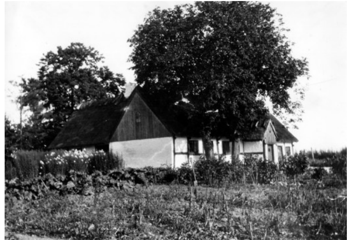
Gl. Kongsgård 1926