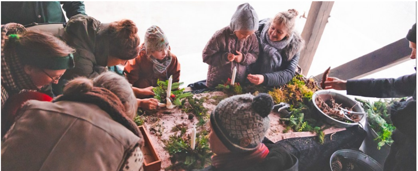
Fra julemarkedet.

I Maries Hus har vi i løbet af året fået installeret faste elradiatorer til afløsning for de strømslugende og udtjente flytbare – lavet med automatisk sluk.