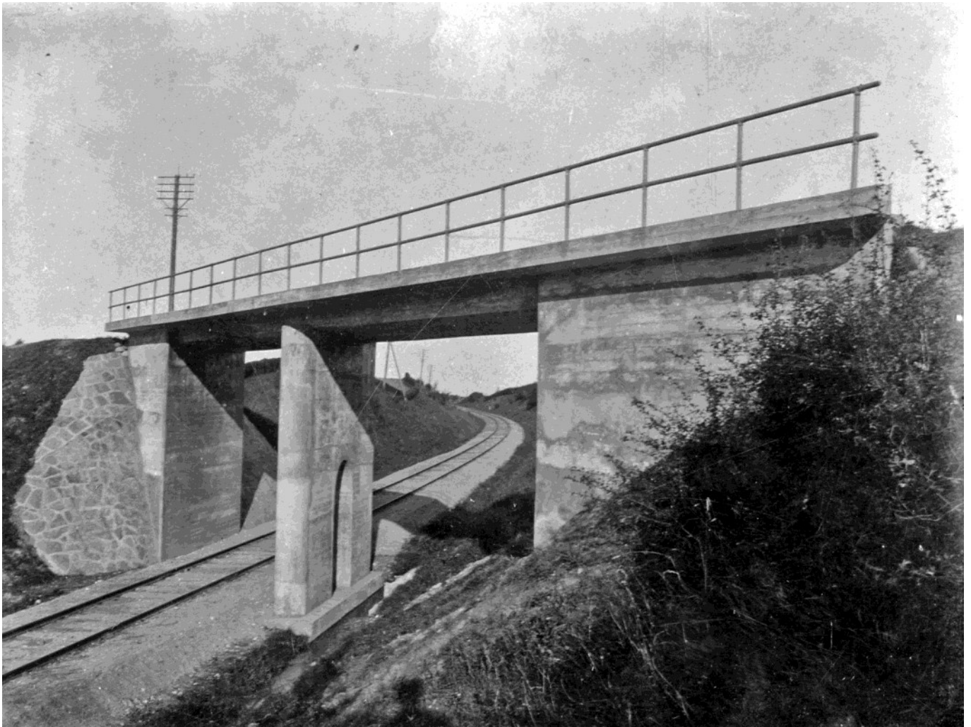
Jernbanebroen på Raunbjergvej lige syd for Buske ved Kirke Hvalsø (ca. 1900-1930)